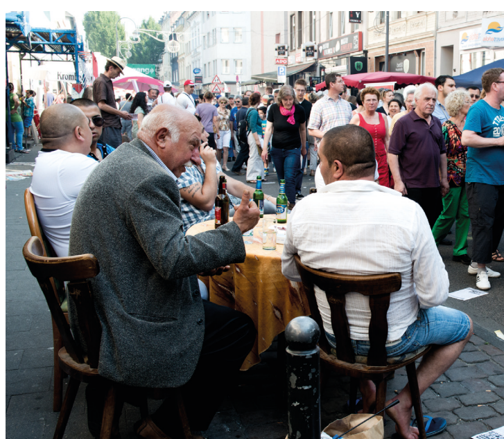
© Sandra Then / Schauspiel Köln