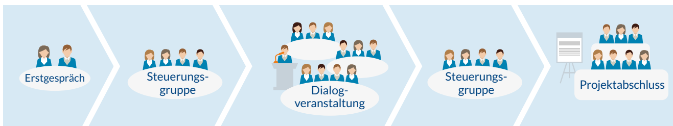
ABBILDUNG 3 Prozessbegleitung in Kommunen