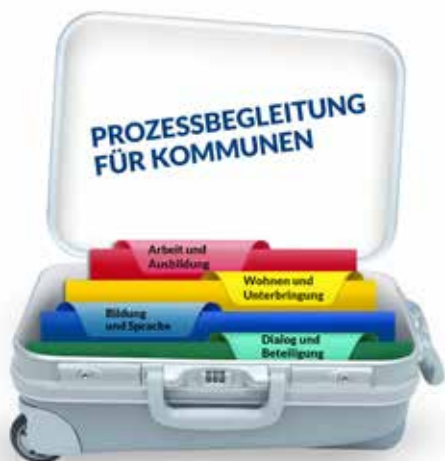
ABBILDUNG 4 Modulkoffer mit Handlungsfeldern